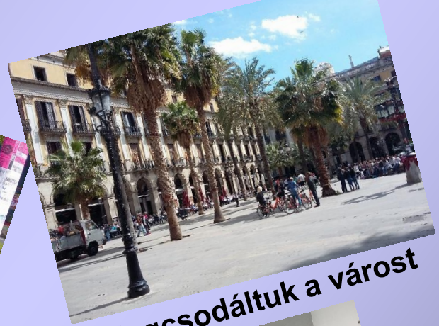
Megcsodáltuk a várost

A házigazdákon és rajtunk kívül holland, olasz, román és német diákcsoportok voltak a projekthéten.