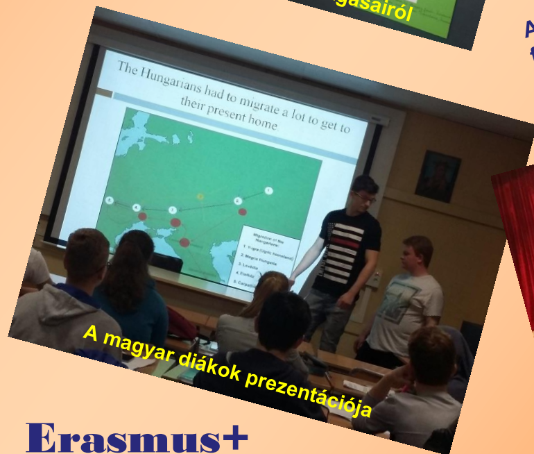
A magyar diákok prezentációja

A projekt fő témáját az Európai migrációs folyamatok adják: azok történelmi háttere, fő típusai, országonkénti hasonlóságai és különbségei.