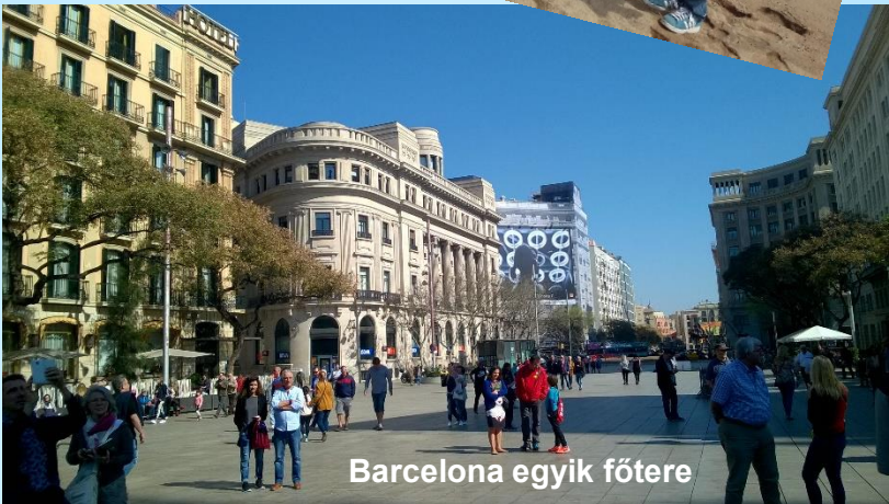
Barcelona egyik főtere