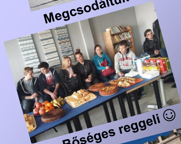
Bőséges reggeli 😊

A házigazdákon és rajtunk kívül holland, olasz, román és német diákcsoportok voltak a projekthéten.