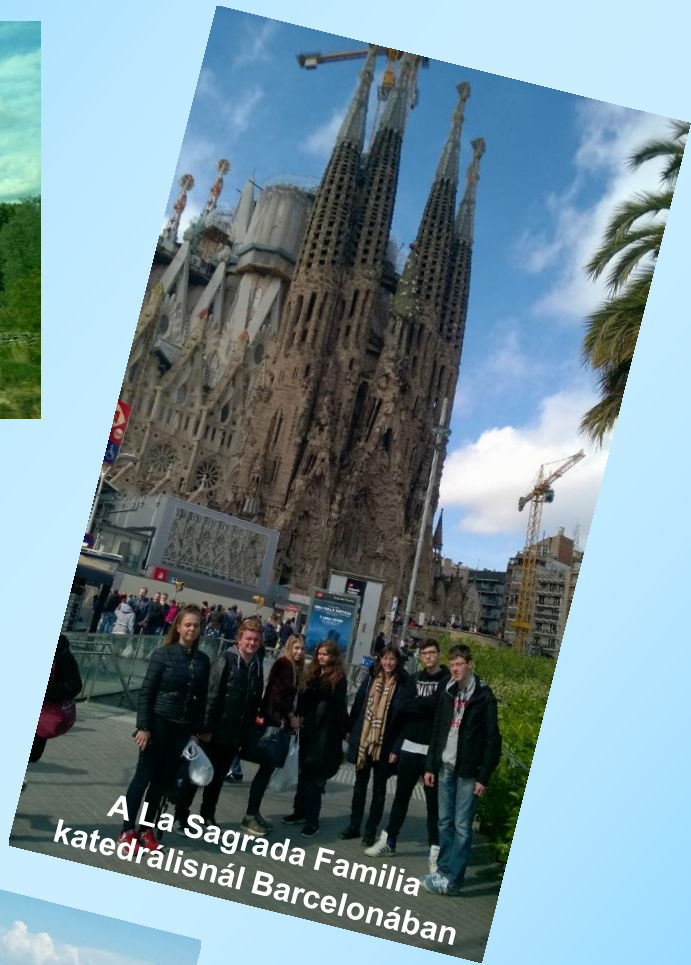
A La Sagrada Família katedrálisnál Barcelonában