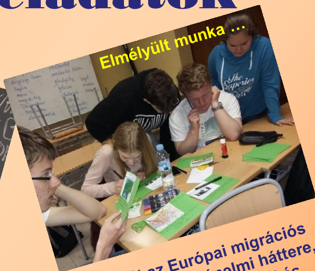
Elmélyült munka ...

A projekt fő témáját az Európai migrációs folyamatok adják: azok történelmi háttere, fő típusai, országonkénti hasonlóságai és különbségei.