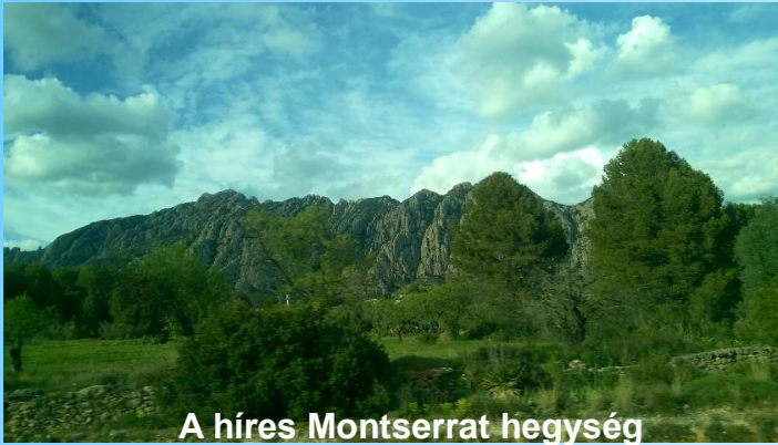
A híres Montserrat hegység