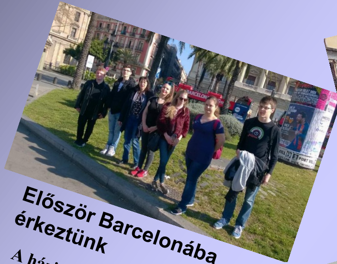
Először Barcelonába érkeztünk

Az Apáczai Gimnázium diákjaiként egy Erasmus+ projektben vehetünk részt, melynek első nemzetközi találkozására Katalóniában került sor.