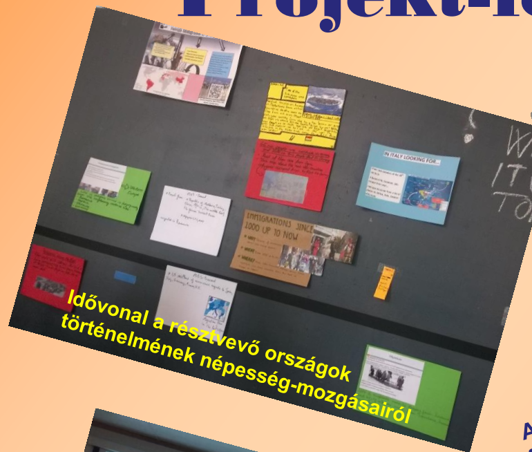
Idővonal a résztvevő országok történelmének népesség-mozgásairól